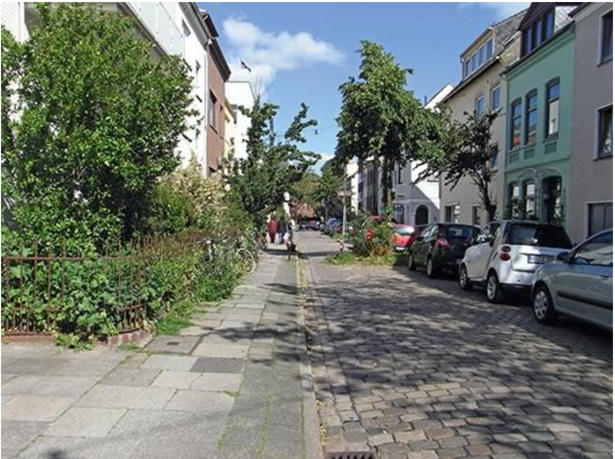
Le Vorgarten, le jardin de devant, notamment en Allemagne.

„Il faut cultiver notre jardin.“ Cette maxime de Voltaire évoque souvent le jardin secret, et le repli sur soi. Mais elle s'applique avec pertinence à cet autre „jardin“ que l'on peut avoir oublié sans parfois comprendre l'enjeu: